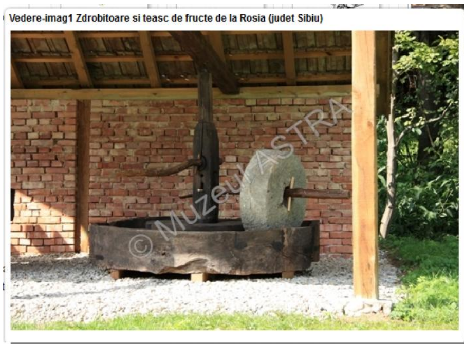
Zdrobitoare de fructe 22