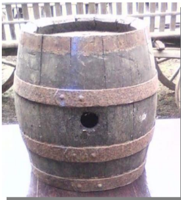
Butoi pentru depozitat uica

Poamele (merele) se uscau cu ajutorul unui co er sau gr tar , care era de fapt o leas împletit din nuiele de alun ce se fixa de marginile unei gropi (1,20 X 1,50 X 0,50 m) cu un strat de lut ce forma o bordur de 10-15 cm în lîime. Pe una din laturile înguste, groapa se continua cu un gang acoperit cu lespezi și lut, la capătul cîruia se afla gura focului. Poamele se așezau pe leasa împletit, se acopereau cu cîrpe, apoi cu scînduri. Se aprindea focul cu vreascuri și cînd ardea bine se astupa gura gangului cu o lespede, astfel ca fumul să se ridice prin leasa și usuce fructele. 25 Pentru realizarea merelor uscate afumate groapa se făcea de obicei lîng rîu. Merele se tăiau în 4, se puneau pe co er. De obicei, cîte o bîtrînă avea grijă de ele, cu rîndul. În sat erau aproximativ 20 de co ere. Le spuneau poame și se mînceau uscate, mai ales în post. 26