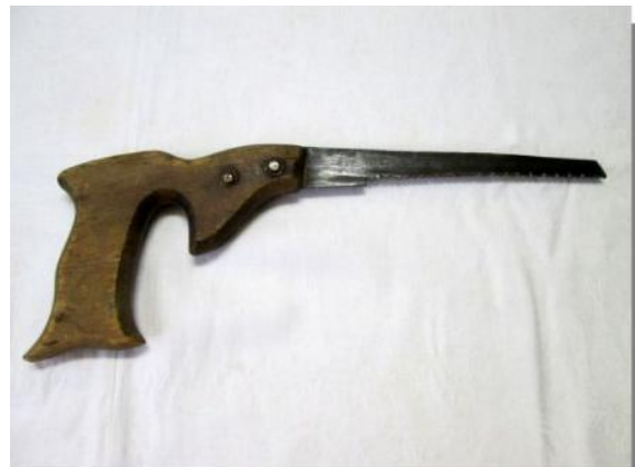
Fier str u