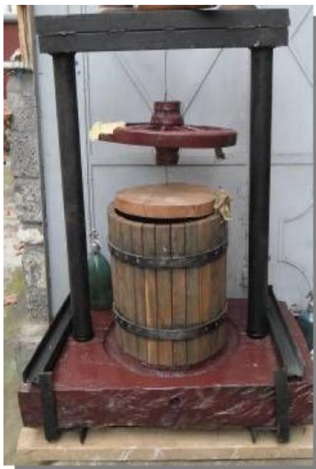
Teasc de mere de dat recent

De dat mai recent sunt teascurile de fructe de tipul celor construite dup model industrial.