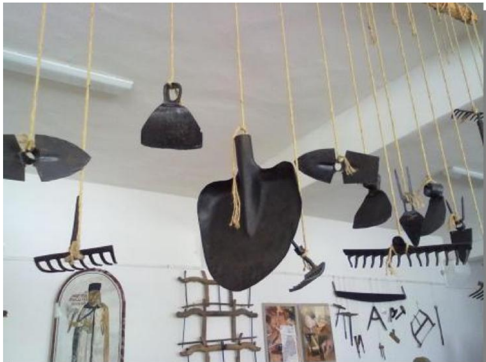
Unelte folosite i în pom rit expuse în muzeul agriculturii 20

Conservarea fructelor pentru iarnă se datorează în primul rând nevoilor umane și pregătirii pentru iarna săracă în feluri de alimente. Dar se datorează în subconștient și concepției, conform creierului nostru, înșelătoare, că nu irosim bunurile primite în dar de la natură.