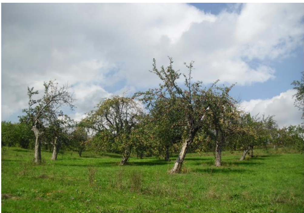
Livad din Sibiel (septembrie 2013)

Ca îngrășăminte se amintesc în literatură folosirea gunoierului de vite.