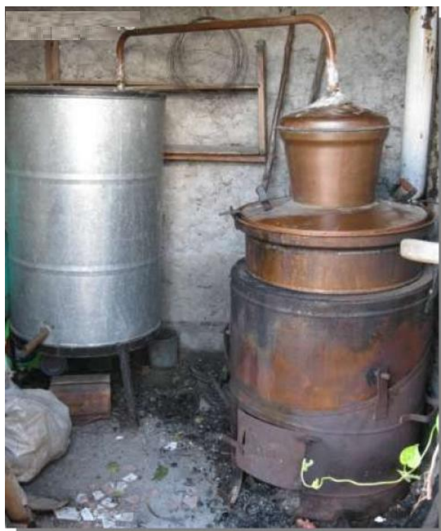
Cazan de uic

Pentru fabricarea uicii se folosea o instalație alcătuită din cazan propriu-zis (din aram) capac de lemn sau tot de aram, eava de evacuare a borhotului după fierbere, soba în care era încălzit cazanul, eava și tubul de răcire și butoiul cu apă și tubul de răcire.