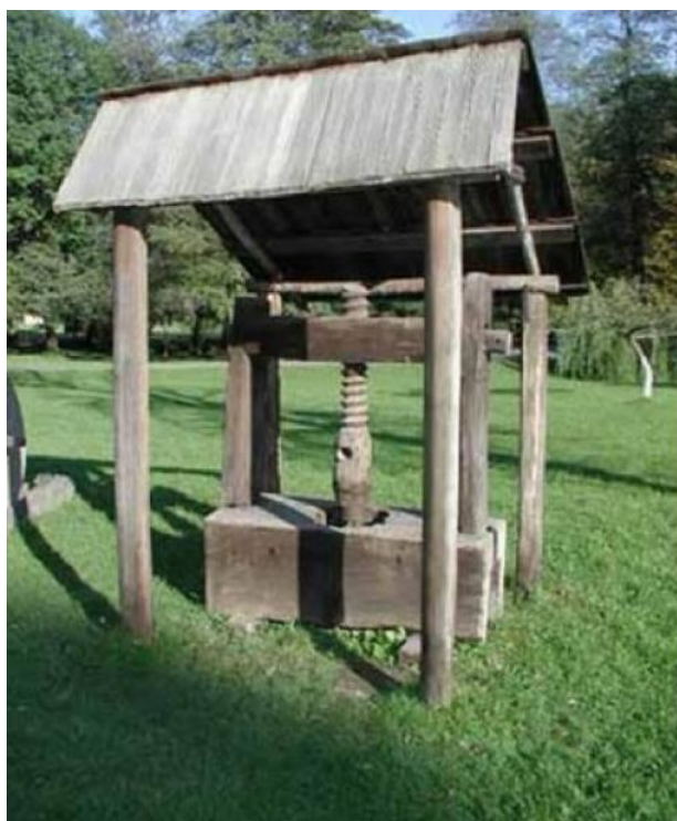
Teasc de fructe; Rășinari, Trăineii, com. Rășinari, jud. Sibiu; Complexul Național Muzeal "ASTRA" - Sibiu;