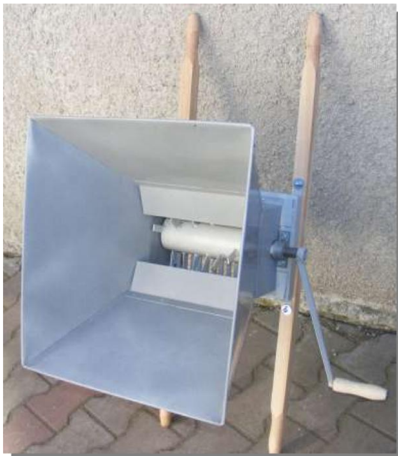
Zdrobitoare de fructe de dat recent

Storsul se realiza în trecut cu teascuri de genul celor de ulei, sau ceva mai simple, alcătuite din butuc cu uluc de scurgere, lădă de scânduri, în care se puneau fructele, fus, prins la un capăt într-un stâlp și având la celălalt o greutate cu rolul de a realiza forța de presiune necesară.