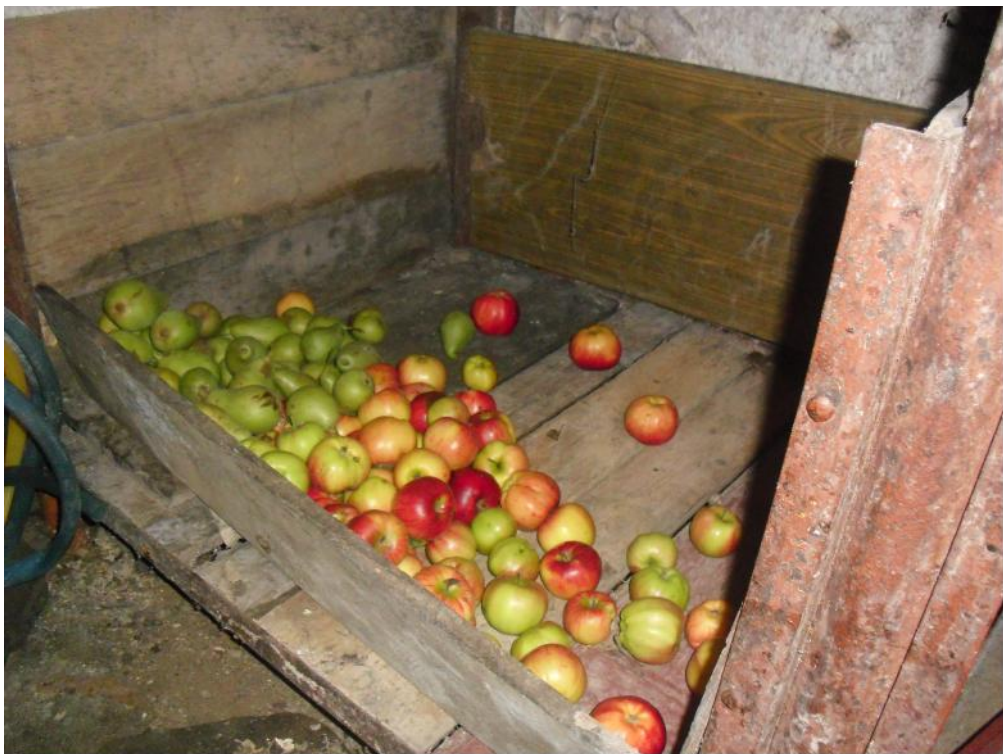
Modalitate de p strare a merelor i perelor în pivni

Fruitele se conserv în pivni e zidite la adâncime în p mânt.